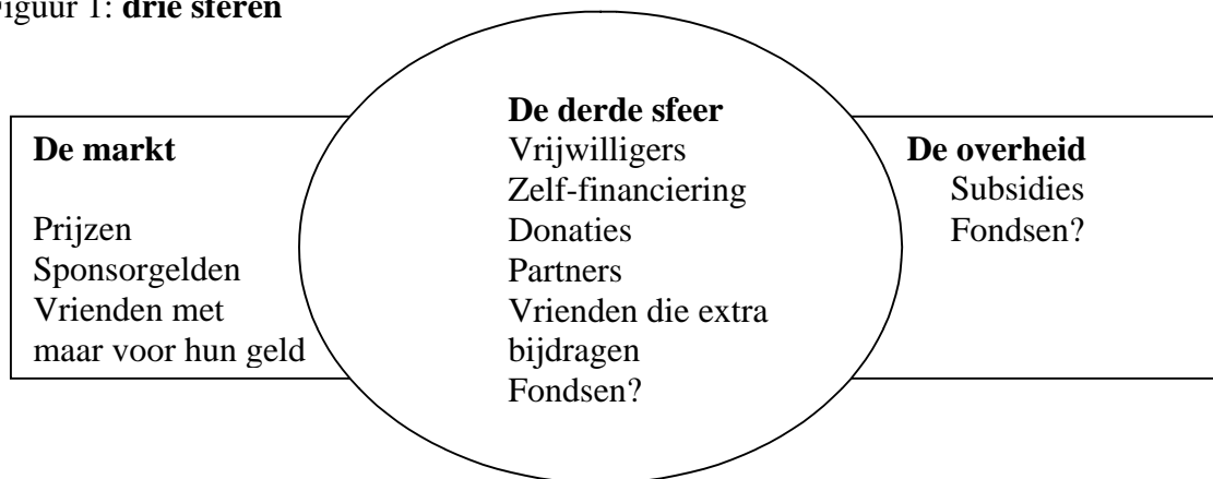
Figuur 1: drie sferen

(Grote fondsen zoals het VSB fonds en de Bankgiro loterij dwingen min of meer hetzelfde gedrag af als de overheid met als belangrijke verschillen dat de politiek erbuiten blijft en de verantwoording minder stringent is).